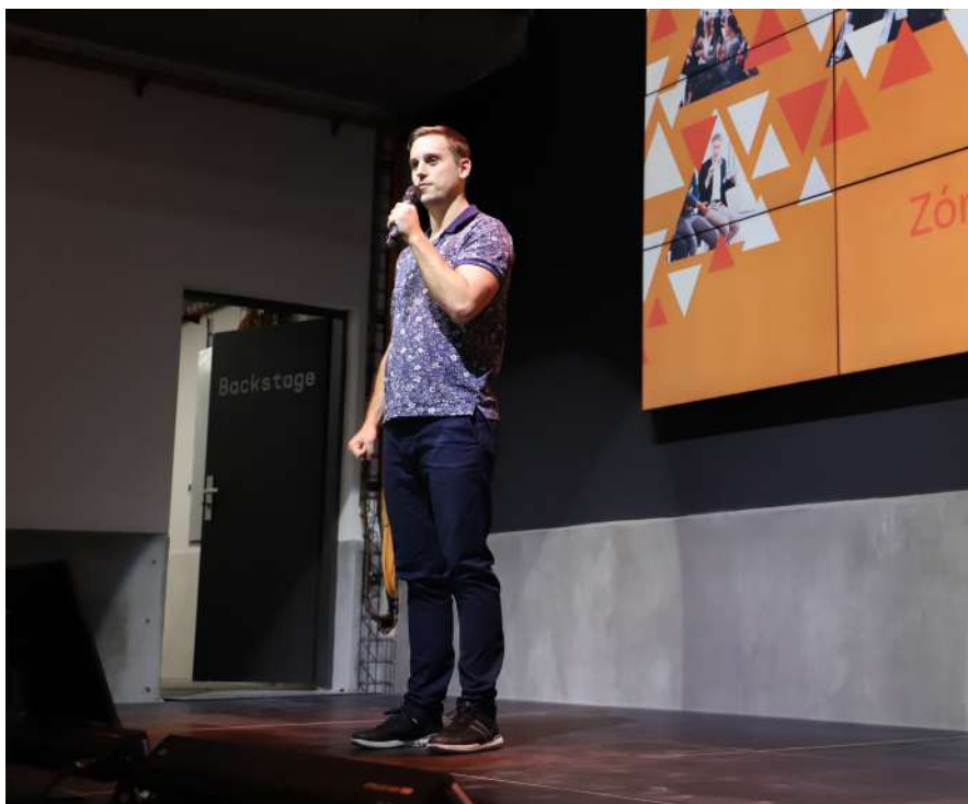
Fotografie z konference "Free Spirit"