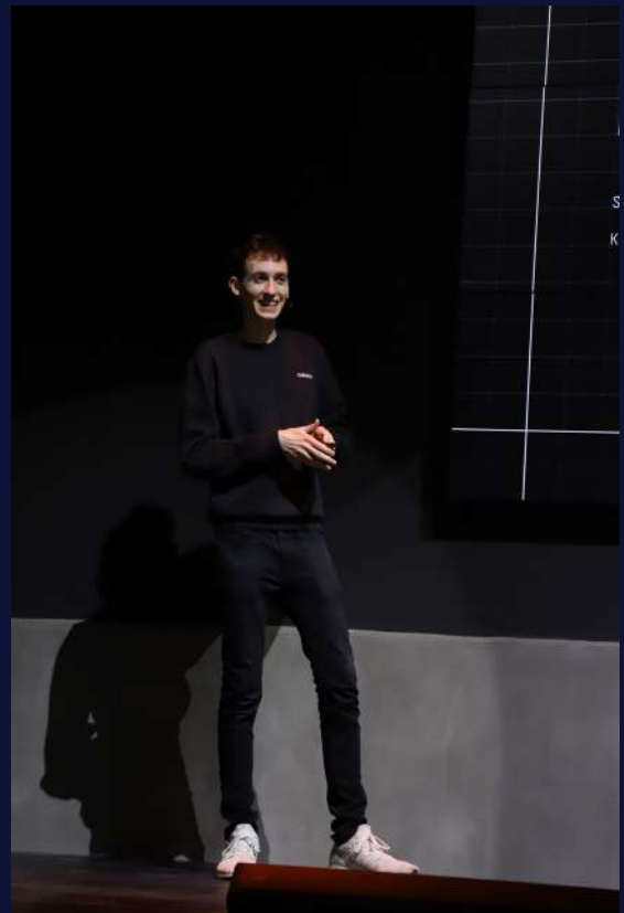
Konference "Free Spirit"