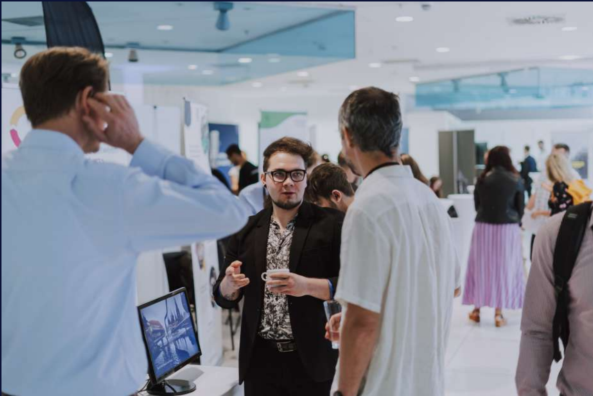
Inovační Vize Prahy 2030