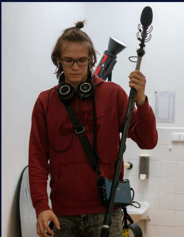
Mediální kemp SSPŠ